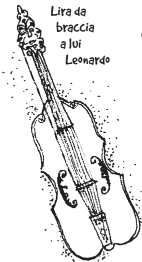
Lira da braccia a lui Leonardo

A fost un excelent atlet. Un muzician foarte bun. Și mai era și arătos. (Deși nu se cunoaște existența vreunui tablou cu el, de fiecare dată când oamenii acelei epoci îl descriau, nu uitau să amintească de frumusețea lui.)